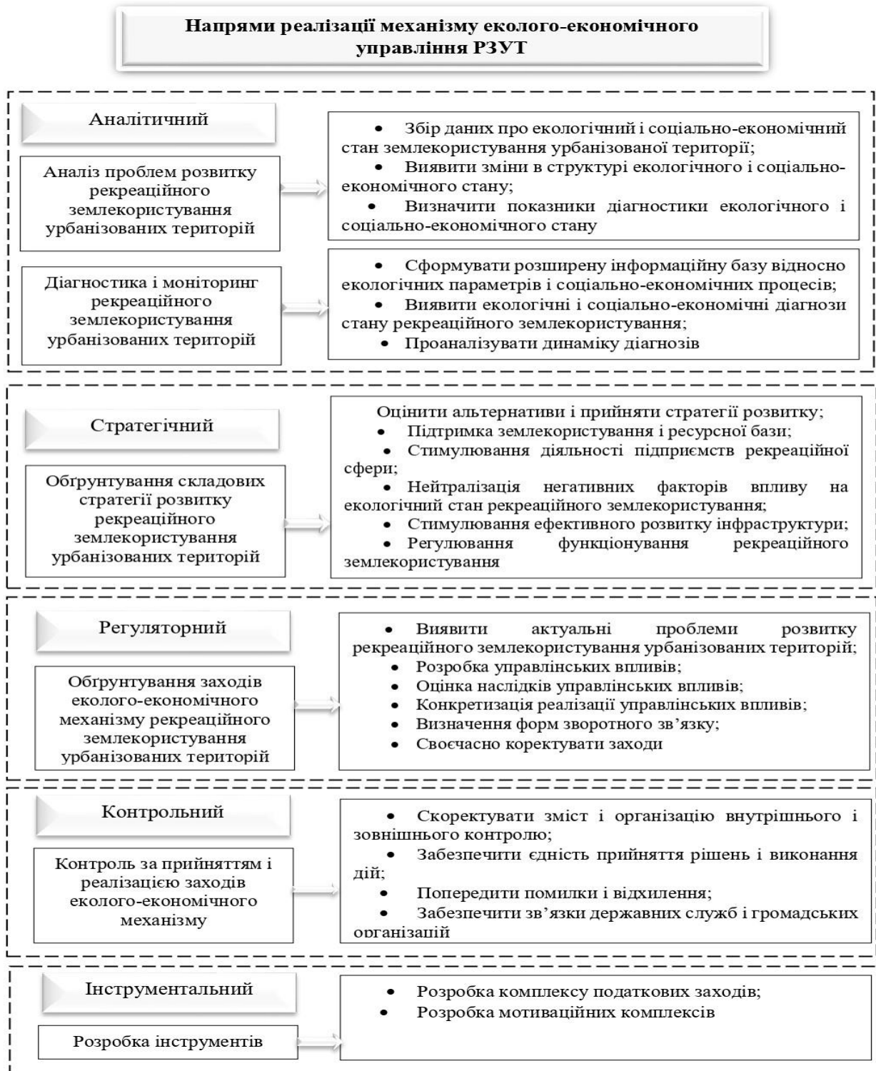
Рис. 3. Напрями реалізації механізму еколого-економічного управління рекреаційного землекористування

державно-приватного партнерства сприяє стратегічному процесу збалансованого розвитку рекреаційного землекористування урбанізованих територій.