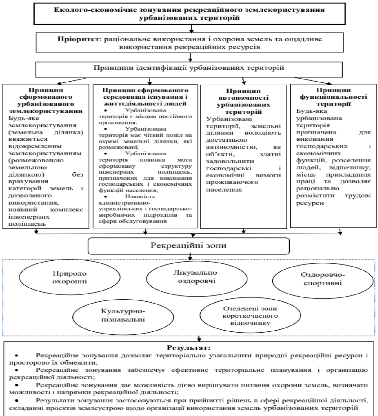
Рис. 2. Науково-методичне забезпечення еколого-економічного зонування рекреаційного землекористування урбанізованих територій

використання й охорону земель, ощадливе використання рекреаційних ресурсів на урбанізованих територіях (рис. 2), а також задоволення потреб населення і рекреантів у відпочинку, оздоровленні та відновленні сил.