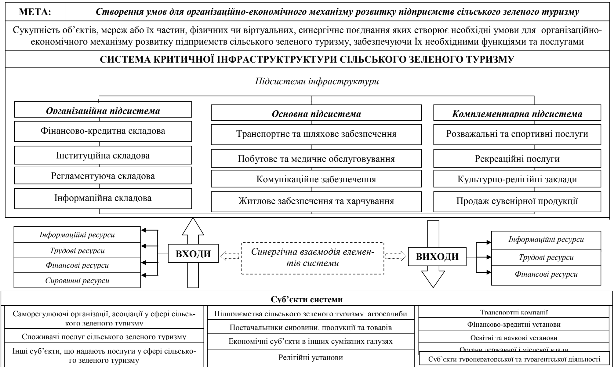
Рис. 1. Структурна модель системи критичної інфраструктури сільського зеленого туризму