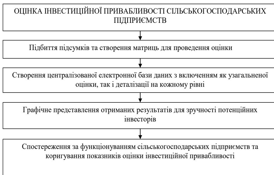
Рис. 3. Схема оцінки інвестиційної привабливості сільськогосподарських підприємств