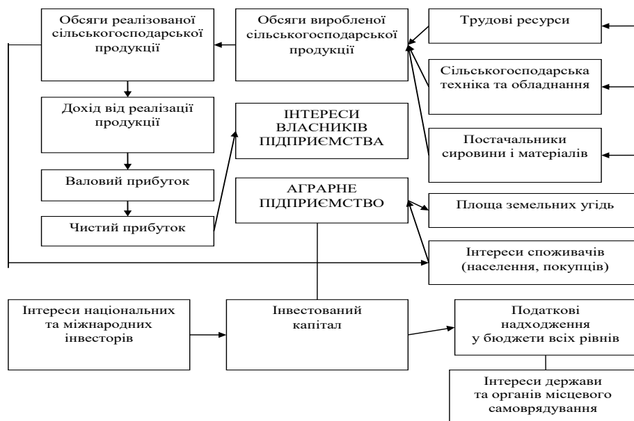
Рис. 2. Модель інтересів учасників інвестиційного процесу в контексті економічної діяльності сільськогосподарських підприємств

тою його власників та ключовим чинником, який сприяє залученню інвестиційних ресурсів, важливо вживати заходів, спрямованих на підвищення вартості аграрного бізнесу.