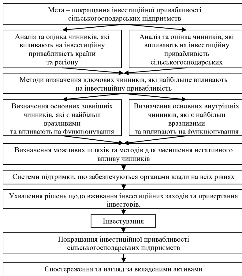
Рис. 4. Механізм стимулювання інвестиційних процесів у сільськогосподарських підприємствах